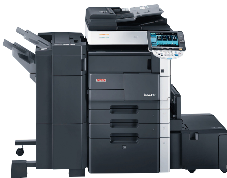
ineo 421 tűzős lyukasztós finisherrel FS-523, Nagykapacitású papírkazet- tás gépasztallal PC-407 papírkazet- tás gépasztallal LU-203

rendkívül gyors duplex nyomtatás, a biztonságos nyomtatás, széleskörű szkennelés, egyedi felhasználó fiók, felhasználói azonosítás és a költségfigyelés. Továbbá hangsúlyozandó a berendezések kompakt kialakítása, egyszerű kezelhetősége, amely főként a nagy színes érintőképernyős kijelzőnek köszönhető.