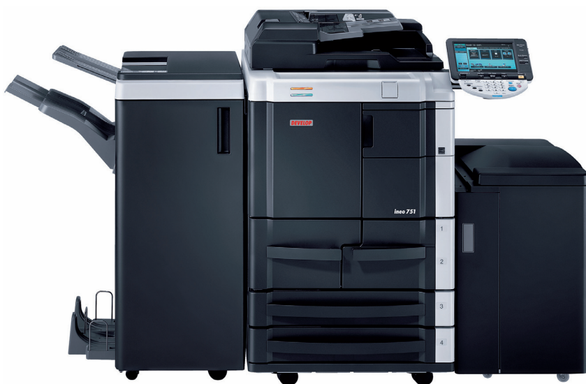
ineo 751 broszúra finisherrel FS-610, és nagykazettával LU-405